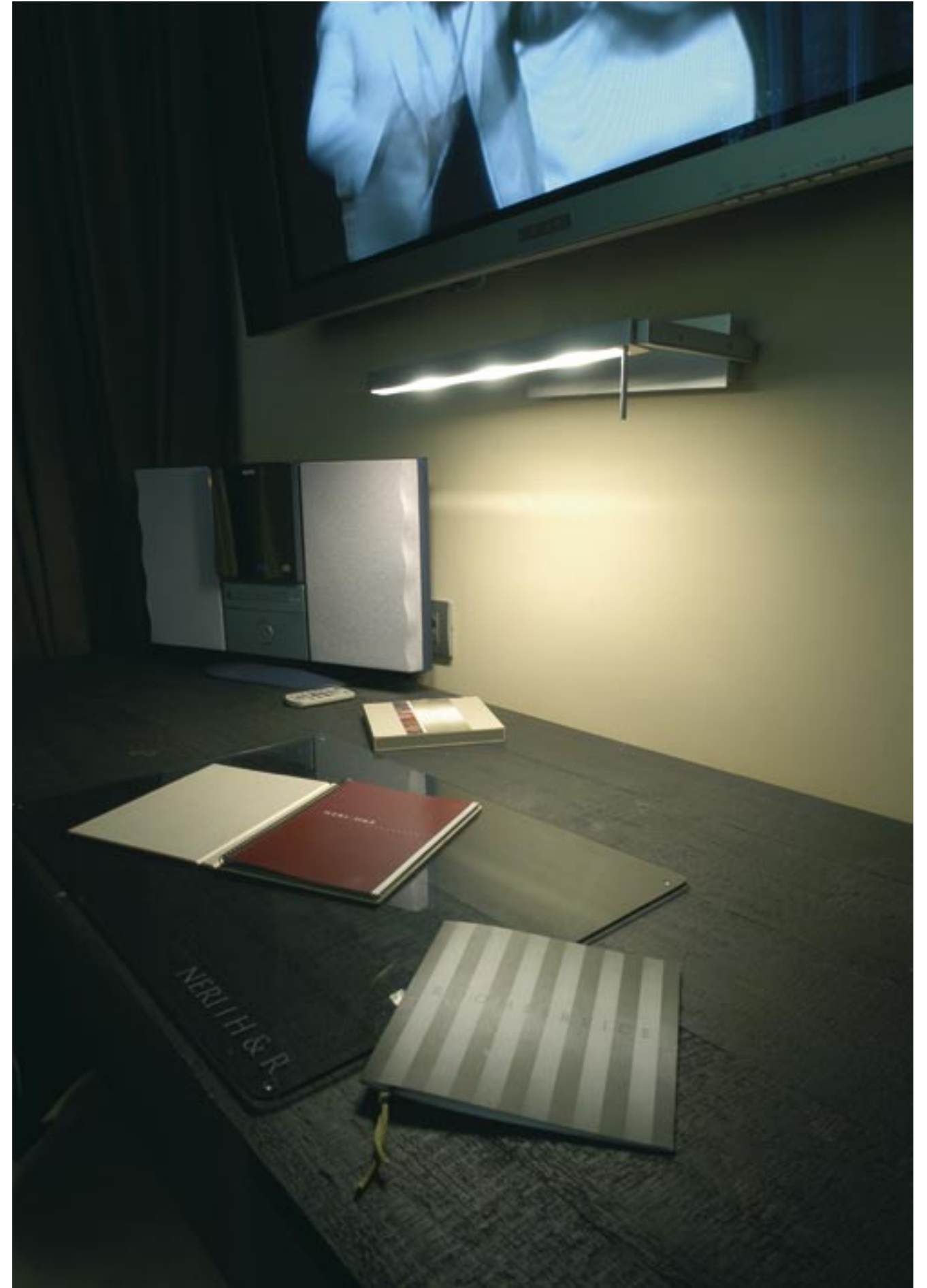
Hotel Neri - Barcelona